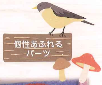
個性あふれる パーツ