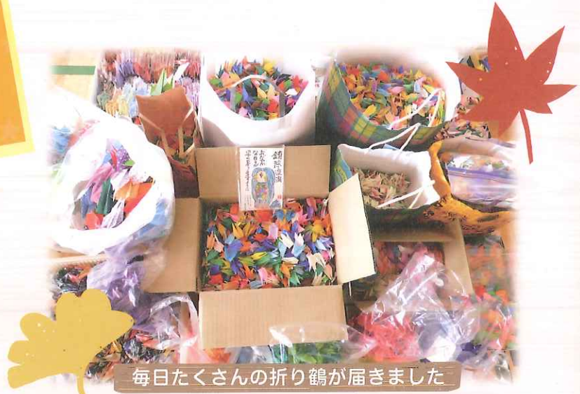
毎日たくさんの折り鶴が届きました

そして、プロジェクト始動から約4か月。ついに、大きな壁画が完成し、けやき体育館に展示しました！ご参加いただいた皆さま、ありがとうございました。壁画は令和3年9月まで展示しています。お近くにお寄りの際はぜひ、けやき体育館に見にいらしてください！