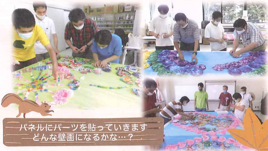
パネルにパーツを貼っていきます どんな壁画になるかな…？