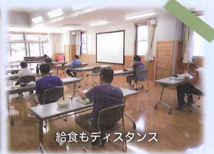
給食もディスタンス