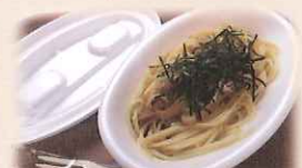
和風きのこパスタ 600円