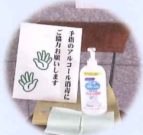
入口の手指消毒液

当事業団では、「新型コロナウイルス感染症対策基本方針」を策定し、徹底した感染予防対策を講じることで、利用者及び職員の命と健康を守りながら、可能な限り事業を継続してまいります。