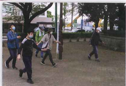
マスクを着けて瀬野辺公園周辺の散歩に出発「今日もたくさん歩けど」