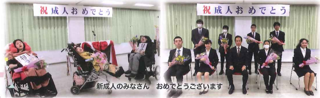
新成人のみなさん おめでとうございます