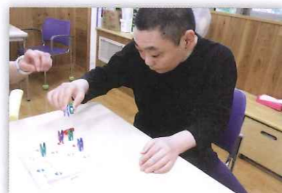
活動室で根気よく取組中「全部できるかな」