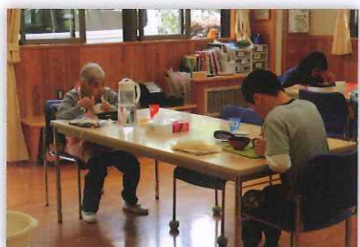
離れた席でとる活動室での食事 ゆったり「いただきます」