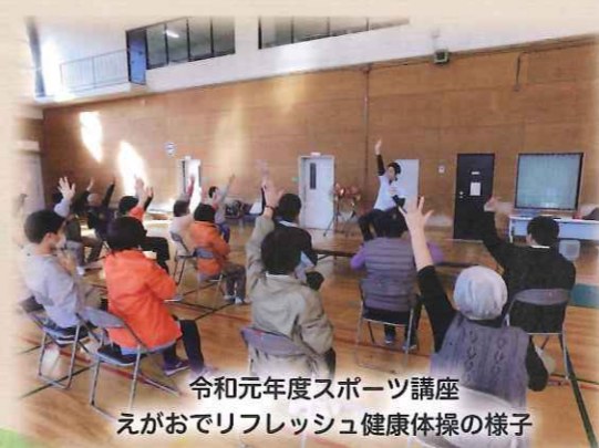
令和元年度スポーツ講座 えがおでリフレッシュ健康体操の様子

今年度は、スポーツ講座は体操を中心に、文化講座は人数制限や体育室での開催など、皆さんが安心・安全に楽しく参加できるよう、徹底した感染症対策を講じてまいります。オンライン講座も開催予定です！お楽しみに♪