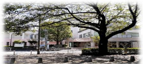
〈10月に入り、ようやく朝夕の暑さは和らいできたように感じます〉

松が丘園祭～銀河の森フェスタ～を10月28日(土)午前10時から午後3時まで4年ぶりに対面の形で開催する予定です。フランクフルトや焼きそば、コロッケなどの模擬店、松が丘園自立訓練事業の皆さんによる華麗なよさこい演舞や各種コンサート。松が丘園を利用された方、就労援助センターの登録者が集うホームカミングデー。けやき体育館によるパラスポーツ体験。地域の皆様の協力によるバザーなど楽しいイベント盛り沢山で開催に向けた準備をしています。皆様どうぞお誘いあわせの上お越しください。お待ちしております。