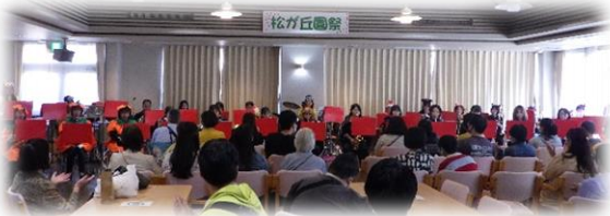
【相模原ウインド・アンサンブルによるコンサート】

よさこい演舞やコーラス、紙芝居、楽器演奏などを対面で披露していただきました。全5組の出演者の熱いパフォーマンスに、会場は大盛り上がりとなりました。