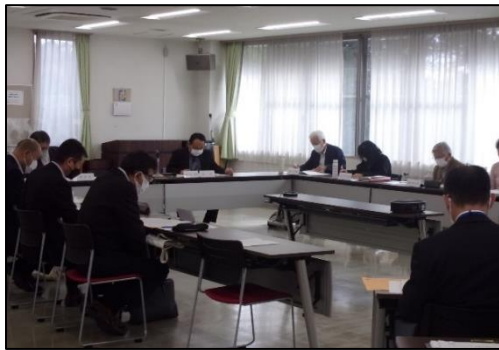
▲対面会議とウェブ会議を組合せた形で開催

第2回全体会議は、10月28日に開催されました。議事として、(1)各部会の活動について、(2)重点目標の進捗状況について、(3)神奈川県主任相談支援専門員養成研修の推薦について、(4)その他を取上げて協議を行いました。主な内容は1面のとおりとなりますが、神奈川県主任相談支援専門員養成研修の推薦については、地域の相談支援の中核を担う人材である、神奈川県主任相談支援専門員の養成研修の推薦方法に関して協議が行われ、相模原市において独自の要件の設定していくことについて承認されました。また、その他として、「神奈川県当事者目線の障害福祉推進条例」や「相模原市人権尊重のまちづくり条例」、「共にささえあい生きる社会さがみはら障害者プラン」についての情報共有も行われました。今回は、対面会議とウェブ会議を組合せた、ハイブリット形式での開催となりましたが、委員の間で活発に議論が交わされていました。