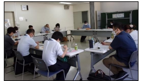
▲各区の地域課題に対する検討を重ねます