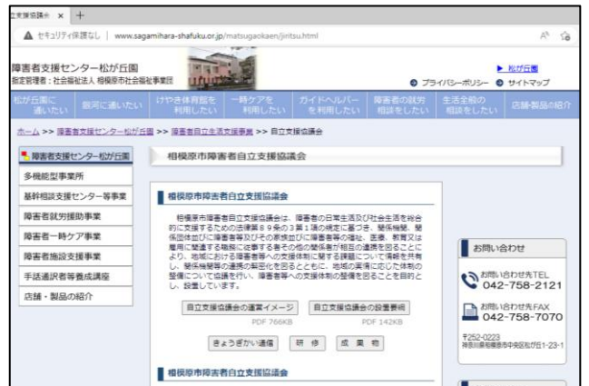
▲社会福祉法人相模原市社会福祉事業団ウェブサイト

また、緑区、中央区、南区で行われたグループスーパービジョンを通して抽出された地域の課題について、関係機関等が協議を行った結果生まれた事例集や提案書等の成果物も掲載していますので、是非、ご覧ください。