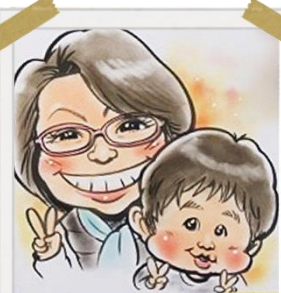
さく しまだりゆうじ し 作：今田隆治 氏

もうしこみほうほう たいいくかんまどぐち でんわ お申込方法： けやき体育館窓口、電話、FAXにてどうぞ！