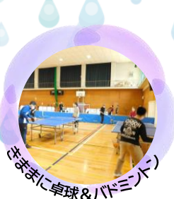
きままに卓球&バドミントン

【日程】5/20(土)・6/24(土) 【時間】9:30~12:00<最終受付11:30> ★けやき体育館内に展示する作品を作ります ★作品は1時間程度で出来るものを想定しています