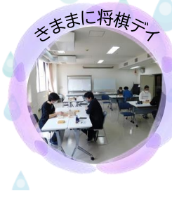
きままに将棋デイ