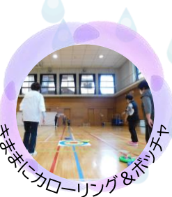
きままにカローリング&ポッチャ