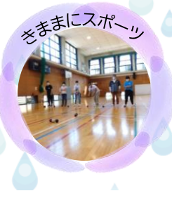
きままにスポーツ