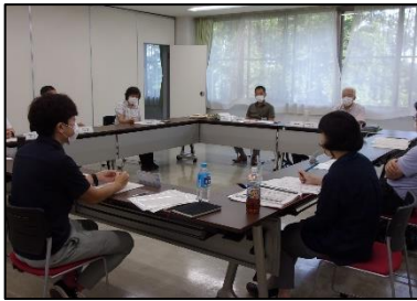
▲感染症対策を行い対面で実施

第1回権利擁護・虐待防止検討部会については、7月11日に対面会議として開催されました。主に今年度の活動について協議が行われており、その結果、「市民向けの取組み」と「虐待防止委員会に関する取組み」という2つの方向性が示されワーキングを組織することとなりました。