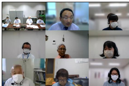
▲第1回全体会議はウェブ会議として開催

第1回全体会議については、7月1日にウェブ会議として開催され、令和4年度の運営体制について、令和4年度の重点目標について、各部会の活動について、南区課題検討会の今後の活動について、ウィズコロナのこれまでとこれからについて協議が行われました。令和4年度の重点目標につきましては「相談支援体制の更なる充実を図る」、「協議会における成果物の普及啓発に取り組む」という2つが定められました。